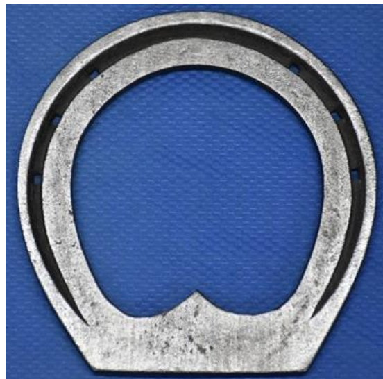
提出用蹄鉄（全溝連尾蹄鉄）