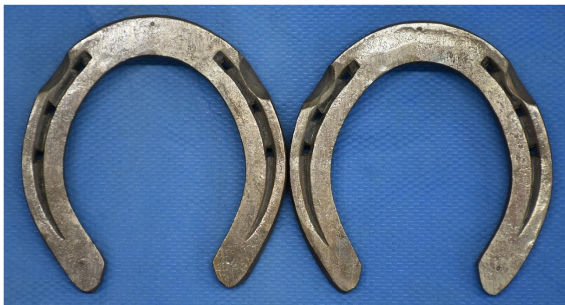
左右後肢用新標準蹄鉄 07 タイプ