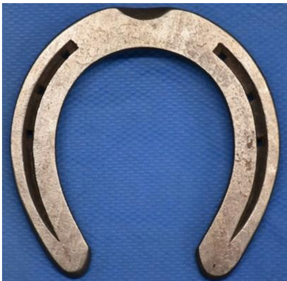
前肢用新標準蹄鉄（07タイプ）